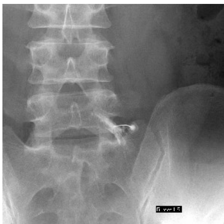
腰椎ルートブロック

ルートブロック（神経根ブロック）は脊髄から出ている神経根にエックス線で透視をしながら針を刺し、局所麻酔薬とステロイドを混合した薬液を注入します。ルートブロックの目的は2つあります。