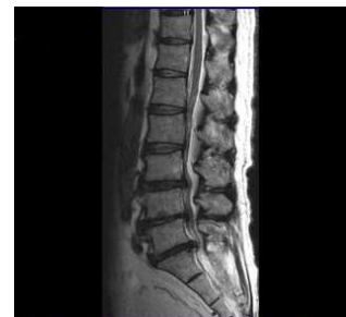
腰部脊柱管狭窄症